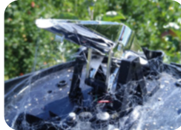
Base de pluviómetro con presencia de telas de araña.