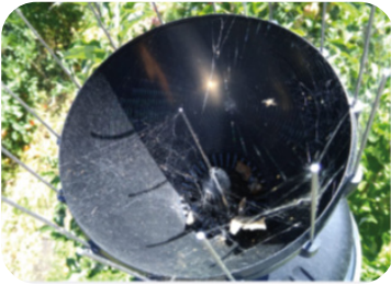
Colector de aguas lluvia con presencia de telas de araña y material vegetal.

Para evitar cualquier confusión infórmenos qué día realizará la limpieza y revisaremos que esto no afecte sus datos del día.